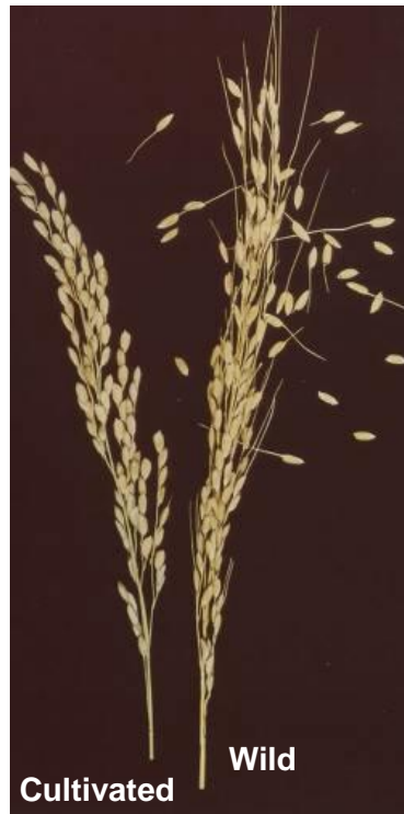
Fig. 1. Riso coltivato e selvatico

La cosiddetta “sindrome da domesticazione” è quindi il risultato dell’accumulo di una o più mutazioni nel DNA, che si traducono nell’alterazione dell’espressione di specifici geni o della loro funzionalità. Tutte le piante coltivate sono quindi organismi geneticamente modificati rispetto alle piante selvatiche da cui derivano, e tale modifica è intrinseca all’agricoltura. Non ha dunque senso giudicare a priori come pericolosa o negativa una modifica genetica, bensì è il suo effetto (la pianta risultante) che va analizzato e valutato.