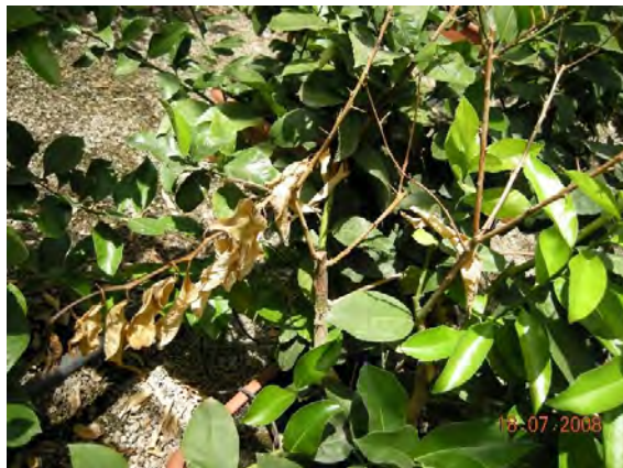
Fig. 2 Sintomi di Mal secco su piantina di limetta