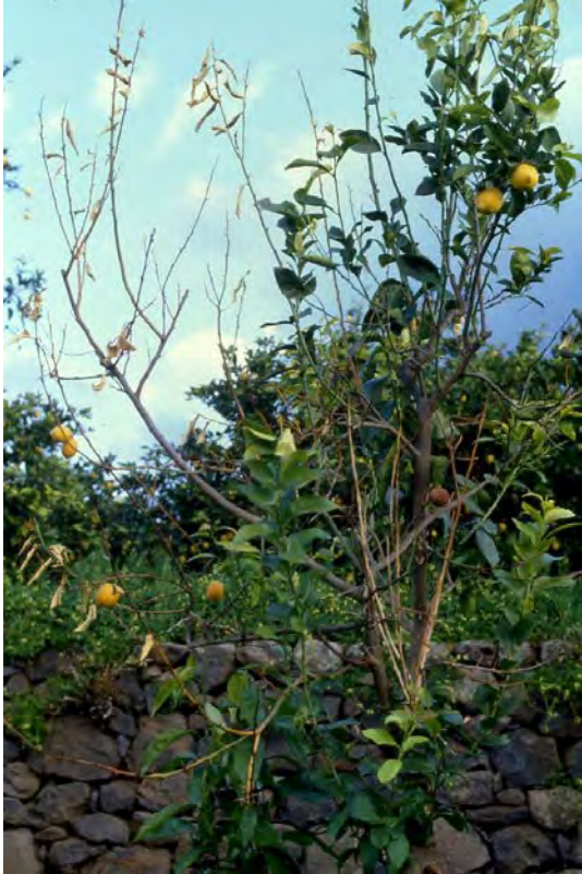
Fig. 7 Rametti apicali secchi di una pianta di limone affetta da Mal secco