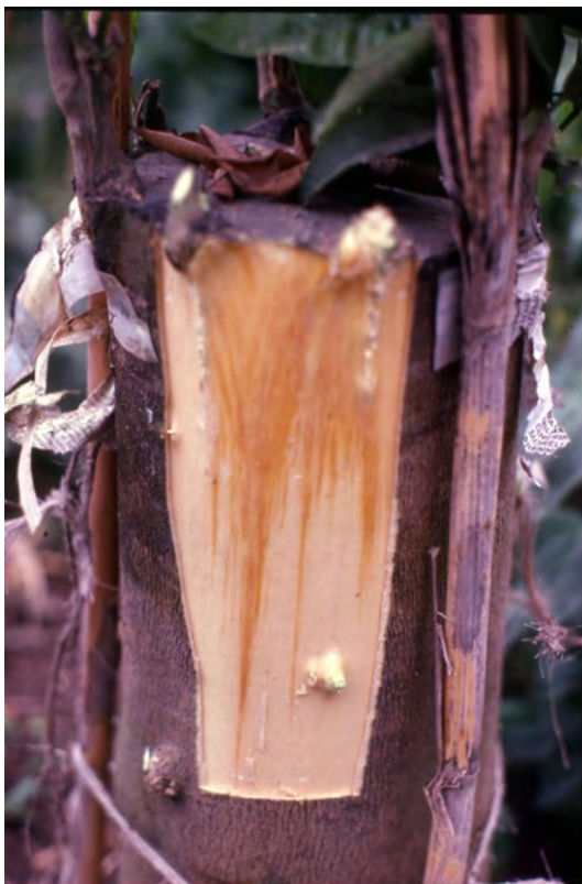
Fig. 9a Reinnesto a corona su pianta di limone gravemente infetta (pratica da evitare); si osserva la tipica colorazione rosa-salmone delle cerchie interne del legno