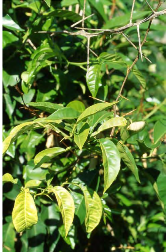
Fig. 8 Pianta di limone con sintomi di Mal secco; si notano nella parte alta rametti giovani disseccati con picnidi