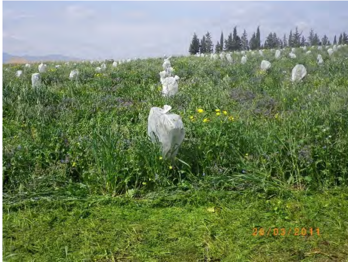
Fig 13 Giovani piantine di agrumi protette con rete in “ tessuto non tessuto ”