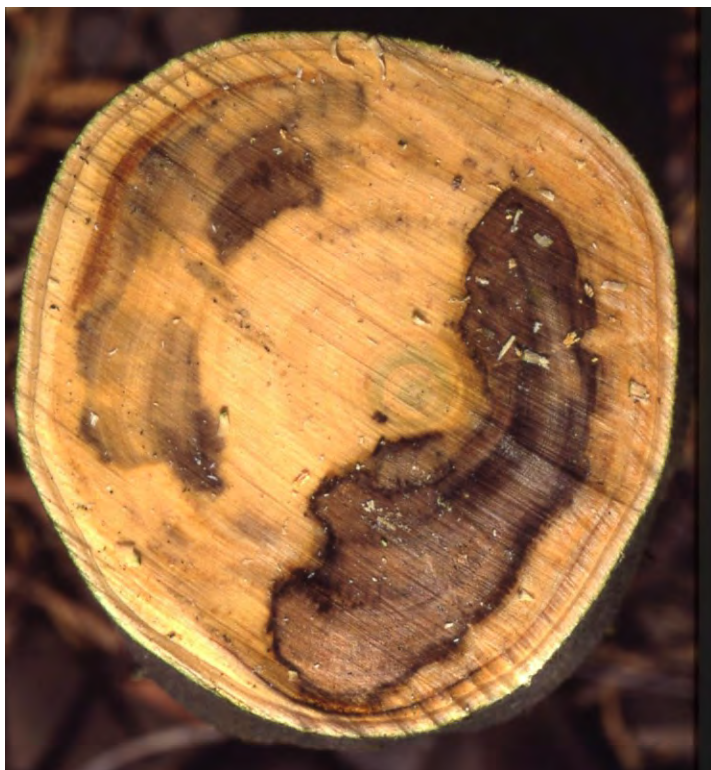
Fig. 3 Sintomi di Mal nero nel tronco di mandarino "Fortune" innestato su Citrus macrophylla