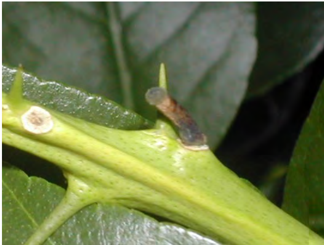
Fig. 1 Persistenza del picciolo su rametto di limone infetto da Mal secco.