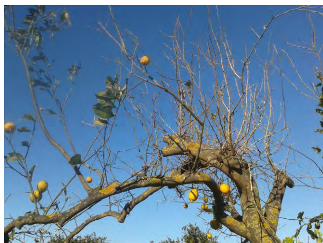
Fig. 10 Pianta di limone con sintomi di Mal secco; si notano nella parte alta rametti disseccati