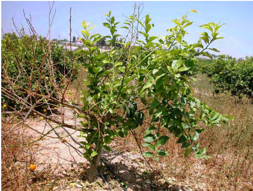
Fig. 4 Piantina di limone affetta da Mal secco

L'intervallo di temperatura in cui possono verificarsi le infezioni è compreso tra 15 e 28°C. Nella regione mediterranea, i periodi di infezione dipendono dalle condizioni climatiche e stagionali locali: in Sicilia le infezioni si verificano prevalentemente da Ottobre ad Aprile. La durata del periodo di incubazione (periodo di tempo che intercorre tra l'infezione e la comparsa dei sintomi) può variare a seconda della stagione. La temperatura ottimale per la crescita del patogeno e l'espressione dei sintomi è di 20-25°C, mentre la temperatura massima per la crescita del fungo (in laboratorio) è di 30°C. Un'umidità relativa prossima alla saturazione o le piogge e temperature tra i 20 e i 25°C favoriscono le infezioni delle ferite artificiali o naturali quali il punto di distacco del picciolo fogliare. Il fungo può rimanere vitale nel suolo all'interno di residui vegetali (foglie, materiale di risulta della potatura, radici) per mesi o anche anni; la durata del periodo di sopravvivenza dipende anche dalle caratteristiche del terreno e nei terreni argillosi è maggiore che nei terreni sabbiosi.