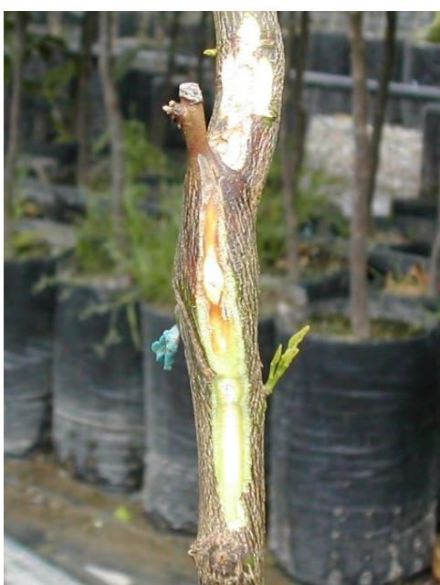
Fig. 9b Colorazione rosa salmone sulle cerchie interne del legno di piantina in vivaio