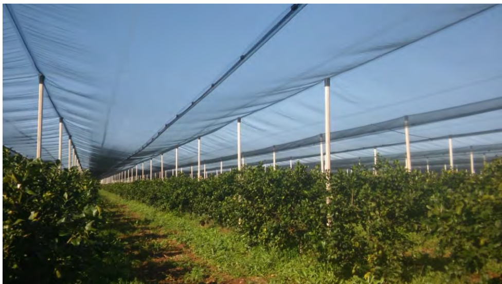
Fig. 14 Nuovo impianto di limone sotto copertura con rete protettiva