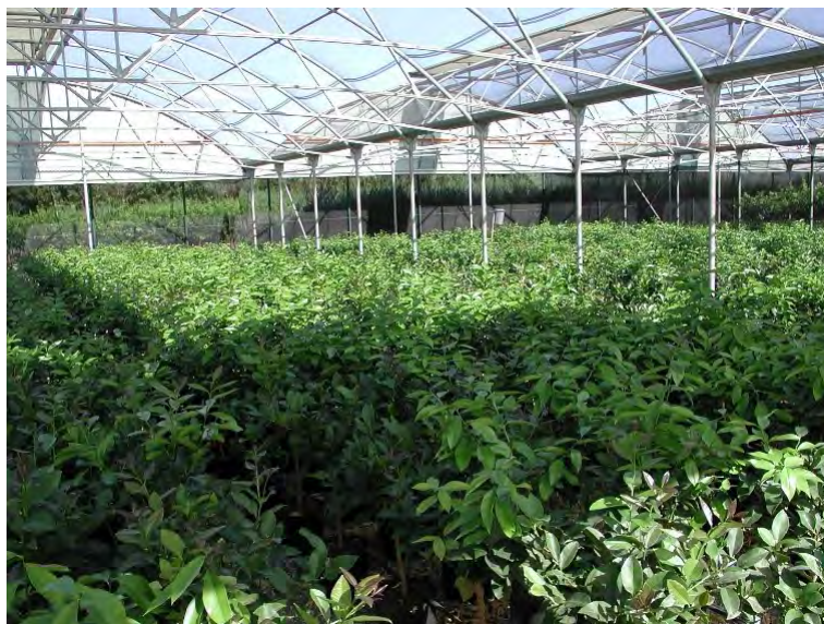
Fig. 12 Struttura protettiva antigrandine in vivaio di agrumi

1.3.1 In vivaio utilizzare reti di protezione antigrandine.