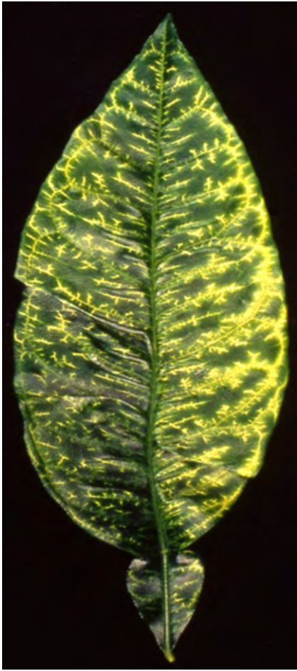
Fig. 5 Sintomi iniziali di decolorazione delle nervature di una foglia di arancio amaro