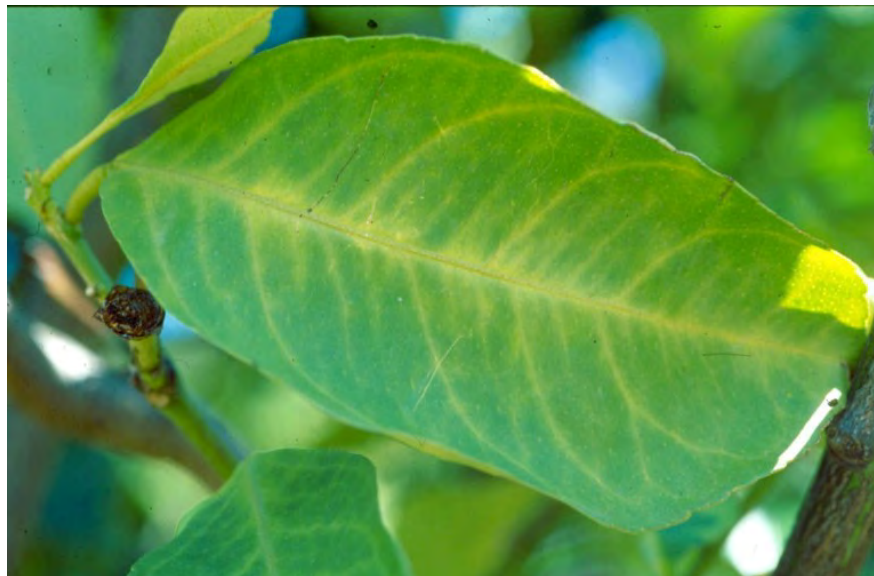
Fig. 6 Sintomi iniziali di decolorazione delle nervature di una foglia di limone